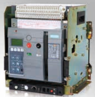
Air Circuit Breaker